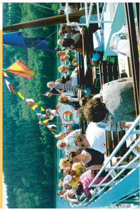
Auf einem Ausflugschiff