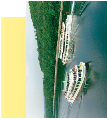
Schiffahrt auf dem Biggeseesee