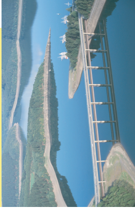
Doppelbrücke für Eisenbahn und Landesstraße